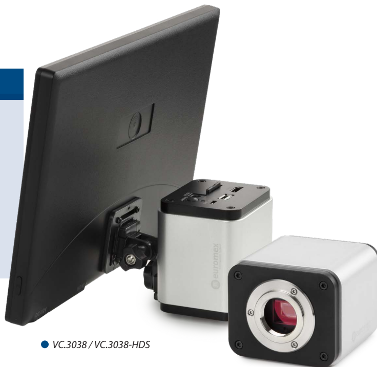
● VC.3038 / VC.3038-HDS